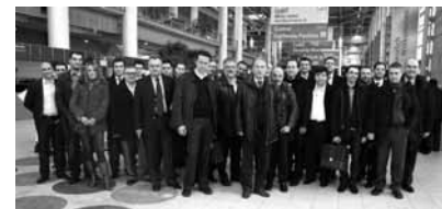
Στιγμιότυπο από την ελληνική επιχειρηματική αποστολή στη CeBIT 2009.

αντίξοι οικονομική συγκυρία, ο κλάδος της Πληροφορικής αναζητά τρόπους και κινείται δυναμικά για να δώσει διεξοδο. Προς αυτή την κατεύθυνση ιδιαίτερα σημαντική κρίνεται η στροφή προς λύσεις που υπόσχονται μείωση κόστους και ενέργειας, με παράλληλη αύξηση της αποδοτικότητας και της κερδοφορίας αντίστοιχα.