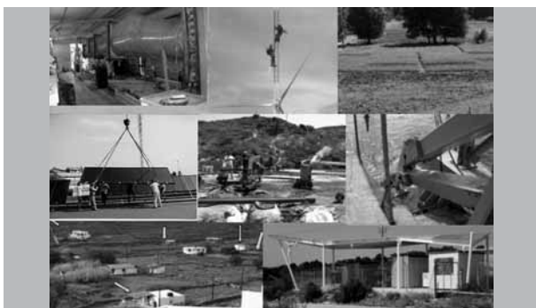
Σημαντικά ερευνητικά έργα υλοποιούνται από ελληνικούς φορείς στον τομέα των Ανανεώσιμων Πηγών Ενέργειας.

Κάθε Κέντρο παρουσίασε κάποια ενδεικτικά ερευνητικά επιτεύγματα. Μεταξύ άλλων, παρουσιάστηκαν οι προοπτικές της οικονομίας του υδρογόνου και γενικότερα των ανανεώσιμων πηγών ενέργειας, μέθοδοι για προστασία των υδατικών πόρων, ο ρόλος της βιολογικής έρευνας στη διαμόρφωση πολιτικών προστασίας και πρόληψης, "έξυπνα" περιβάλλοντα και τεχνολογίες διάχυτης νοημοσύνης, νέες εξελίξεις στα συστήματα μηχανικής μετάφρασης, κεραμικά προϊόντα ηλεκτρομαγνητικής απορρόφησης κ.ά.