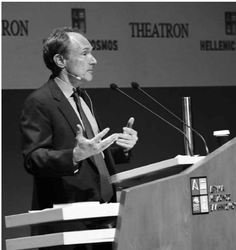
Ο Sir Tim Berners Lee στο συνέδριο του ΙΜΕ.

Οι εισηγήσεις των ομιλητών διατίθενται στον δικτυακό τόπο του συνεδρίου.